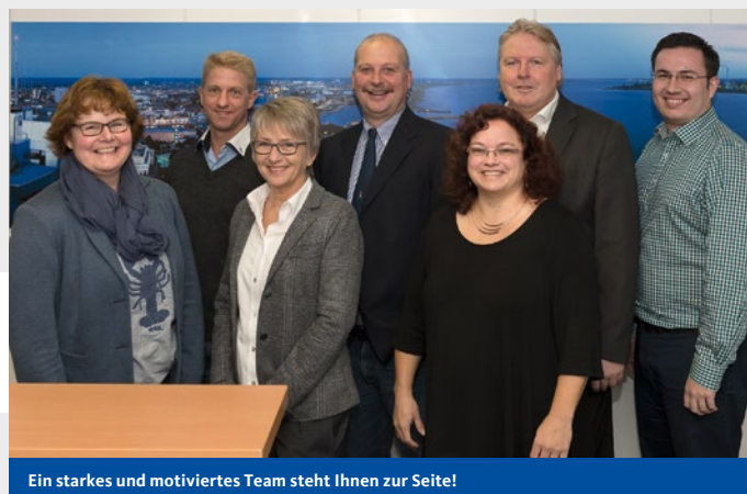
Ein starkes und motiviertes Team steht Ihnen zur Seite!

Sparkassenbetriebswirt bietet kundenorientierte und individuell zugeschnittene Finanzierungsberatungen an und berücksichtigt dabei aktuelle Marktgegebenheiten und Fördermöglichkeiten. Für seine