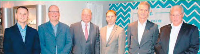
Die Kollegen der Immobilienbörse gratulieren zum Jubiläum.

100 Jahre Immobilien, Hausverwaltung und Versicherungen in Bremerhaven!